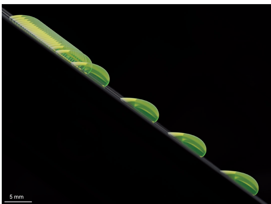
1. Chronophotographie d'une goutte d'un mélange eau-glycérol (colorée pour une meilleure visualisation) dévalant sur un plan incliné en élastomère silicone (polydiméthylsiloxane, PDMS). La taille de la goutte est de quelques millimètres et l'intervalle de temps entre deux images est égal à une seconde. On observe clairement deux régimes distincts, caractérisés par deux vitesses constantes, atteints successivement par la goutte. La deuxième vitesse est plus grande que la première.

Les termes suivis d'un astérisque sont explicités dans le glossaire, p. 17.